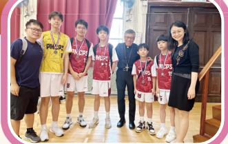
「主教孟小學五人足球2023」UP6組優異獎