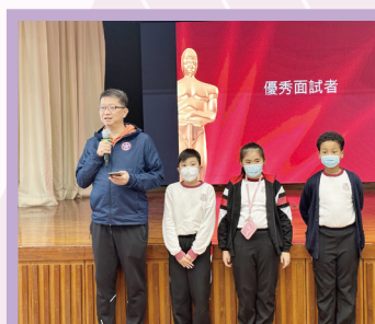
職場的優秀面試者