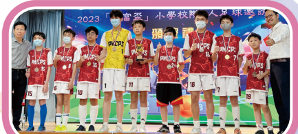
「2023和富孟小學校際五人足球邀請賽」盃賽組季軍