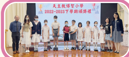
「JSMA聯校音樂大賽2023小學小組中樂合奏」銀獎