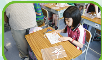
製作發光端午節賀卡