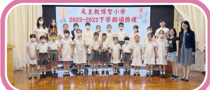
「JSMA聯校音樂大賽2023小學合唱團挑戰組」銅獎