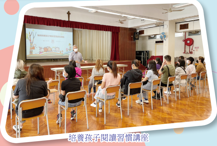
培養孩子閱讀習慣講座