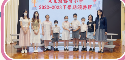
「JSMA聯校音樂大賽2023小學小組合唱」銀獎