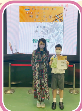
「第一屆全港小學硬筆·毛筆書法比賽」毛筆組優異獎