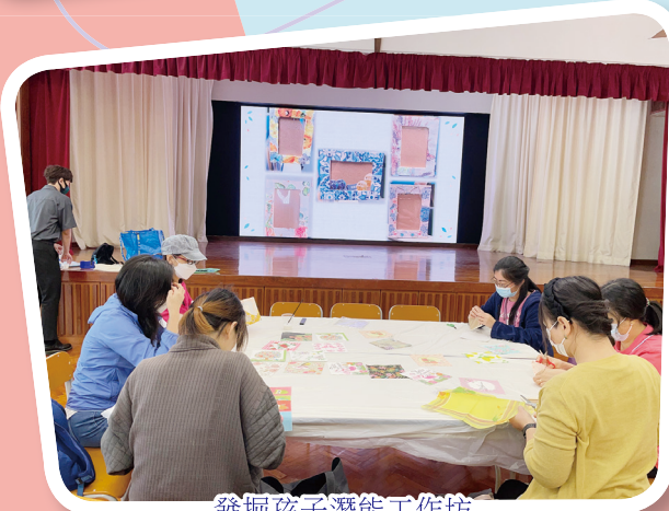
發掘孩子潛能工作坊