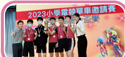
「2023小學電競單車邀請賽」男子團體金盃賽亞軍