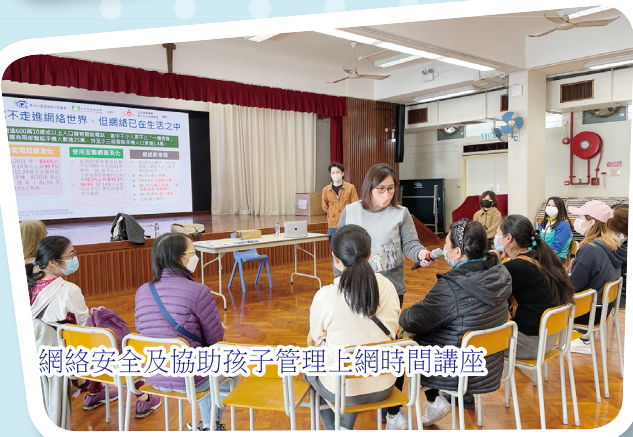
網絡安全及協助孩子管理上網時間講座