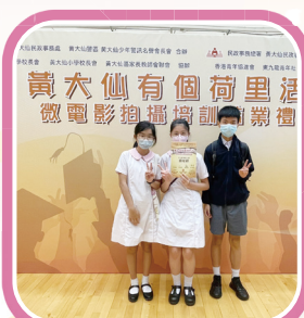
「黃大仙有個荷里活」微電影課程畢業禮